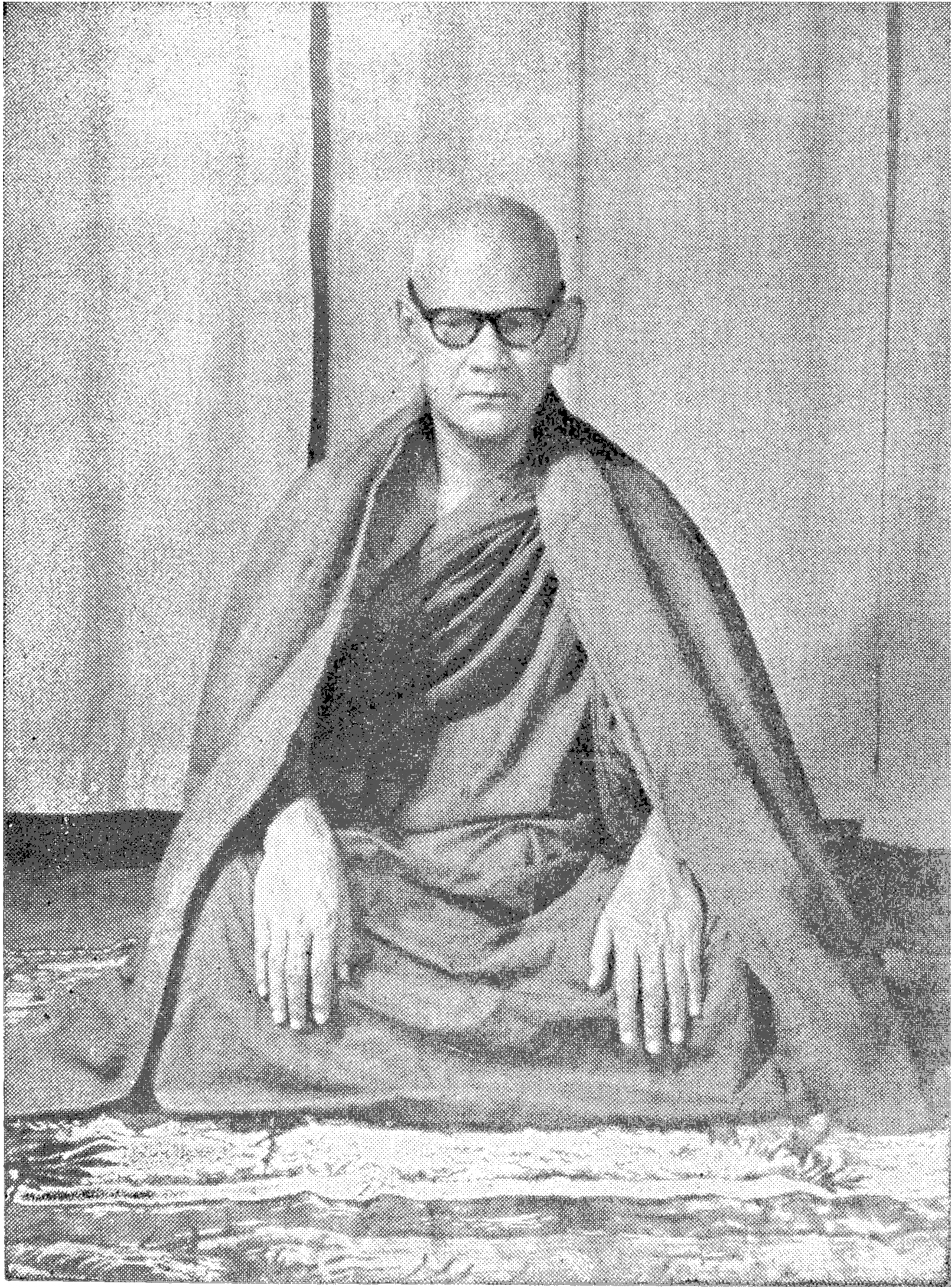
အဂ္ဂမဟာပဏ္ဍိတ မဟာစည်ဆရာတော်