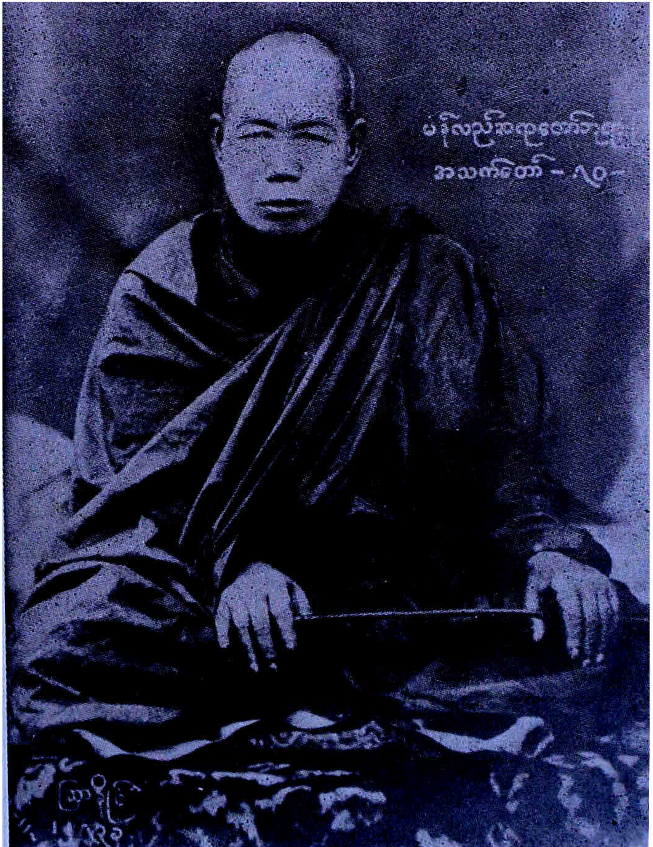
ကျေးဇူးရှင် မန်လည်ဆရာတော်ဘုရားကြီး၏ပုံတော်